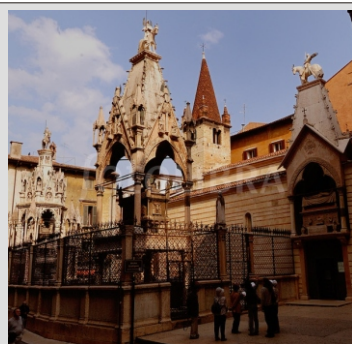
GROBNICE DRUŽINE SCALIGERI

Sledi še ogled GOSPOSKEGA TRGA in grobnic najbolj cenjene veronske družine vladarjev Scaligeri. Sprehod mimo cerkve Sv. Anastazije do KAMNITEGA MOSTU in nato obisk STOLNICE. Tu boste spoznali znamenito Tizzianovo sliko Marijinega vnebovzeta in arheološke izkopenine prvotne predhodnice cerkve. Nekaj časa boste tudi prosti, ob 18.00 uri pa se bomo poslovili od mesta. V Ljubljani bomo pozno.