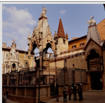
VERONA - GROBNICE SCALIGERI

Gardsko jezero je s svojo izjemno lego pod Alpami prava poslastica za turiste in obiskovalce. Tisočletja stara zgodovina je pustila sledove na vsakem koraku, zato je obisk mest in naselij ob jezeru pravi užitek. Mediteranski vpliv je ustvaril izjemne pogoje za rast limon, pomaranč in drugega južnega sadja, vrtnin in oljk. Tudi turizem je izjemna panoga in obiskovalec ima res kaj videti. Idilična mesteca kot so GARDA, MALCESINE in RIVA, pa čudovita cesta GARDESANA, ki vodi po zahodni obali jezera prevzamejo še tako zahtevnega gosta.