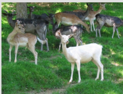
DIVJAD NA POSESTVU JEŽOVNIK

Odhod avtobusa ob 07.00 uri. Vožnja preko Sevnice in Senovega do PODSREDE. Tu bo naš prvi postanek za ogled gradu in njegove zbirke. Vse podrobnosti bomo izvedeli od lokalnega vodiča. Po ogledu se odpeljemo še do BISTRICE OB SOTLI, kjer bomo v gostišču "ŠEMPETER" postreženi z odlično malico. Prestop na Hrvaško in nato tik ob meji obisk vasice KUMROVEC. Tu si bomo najprej ogledali rojstno hišo "našega" nekdanjega predsednika JOSIPA BROZA TITA ter spominski park, ki je kot muzej na prostem. Čas bo tudi za nakup spominkov, nato pa nadaljevanje poti do gradu TRAKOŠČAN, ki velja za najlepšega na Hrvaškem. Bogata oprema in seveda zgodovina kraja in gradu bosta predstavljena z lokalnim vodnikom. Povratek nazaj v Slovenijo preko mejnega prehoda Dobovec, ter preko Rogaške Slatine do OLIMJA. Tu bomo v gostišču "JEŽOVNIK - JELENOV GREBEN" ob odlični večerji zaključili naš program. Povratek domov v poznih urah.