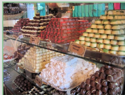
ČOKOLADNICA V OLIMJU